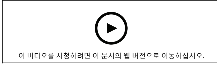
AXIS A4120-E Reader with Keypad 설치 비디오