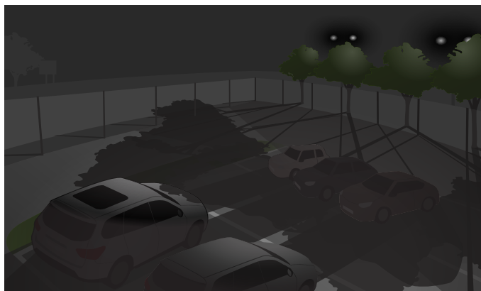
La misma escena en la que los focos detrás de los árboles provocan largas sombras