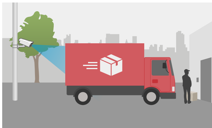
カメラの視界が一時的に駐車した配送トラックによって遮られている