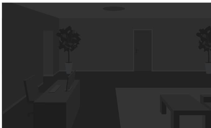
Ta sama scena bez źródła światła

Włączenie światła również może całkowicie zmienić wygląd sceny, na przykład przez to, że powoduje cienie.