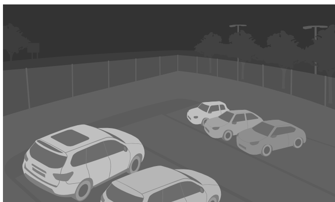
Ciemna scena na zewnątrz z oświetleniem w podczerwieni

Włączenie światła również może całkowicie zmienić wygląd sceny, na przykład przez to, że powoduje cienie.