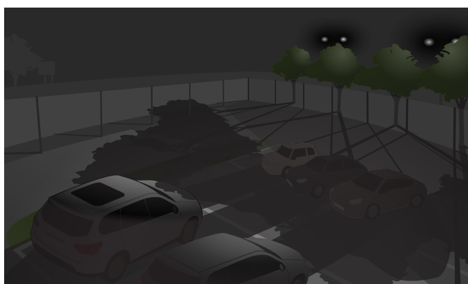
Ta sama scena, w której reflektory za drzewami powodują długie cienie