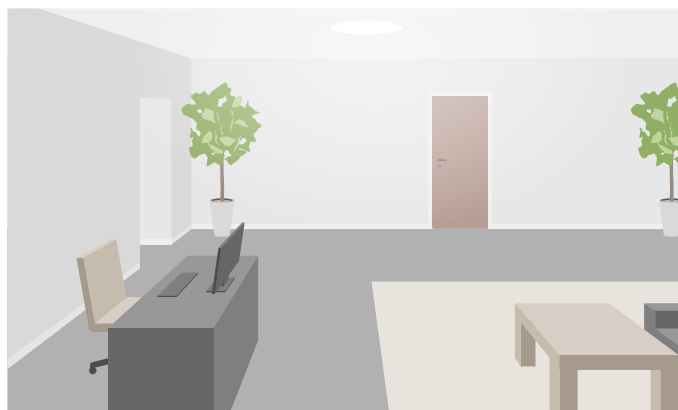
Scena w pomieszczeniu z wystarczającą ilością światła

Włączenie lub wyłączenie światła powoduje nagłą zmianę w scenie. W przypadku kamer bez wbudowanego oświetlenia w podczerwieni lub wystarczającego oświetlenia obraz, który nagle staje się ciemny, może spowodować wysłanie przez aplikację zdarzenia z powodu zarówno niedoświetlonego, jak i zablokowanego obrazu. W przypadku kamer z wbudowanym oświetleniem w podczerwieni zachodzi ryzyko, że nagła utrata światła spowoduje wysłanie przez aplikację zdarzenia w przypadku przełączenia kamery na tryb nocny.