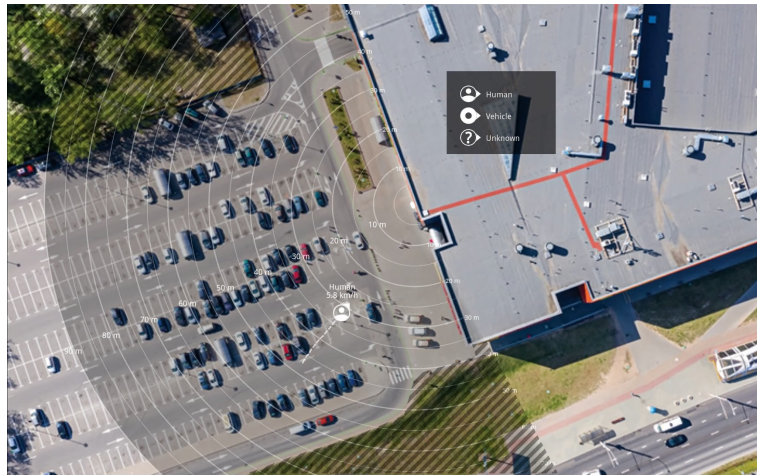
AXIS D2110-VE Security Radar 的参考地图示例。

如果您只需要车辆的统计信息，请转到雷达 > 场景并选择场景。编辑场景，在按对象类型触发下，取消选中人员。