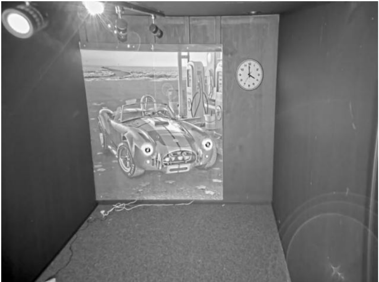
Des reflets infrarouge apparaissent dans le coin inférieur droit de cette image.